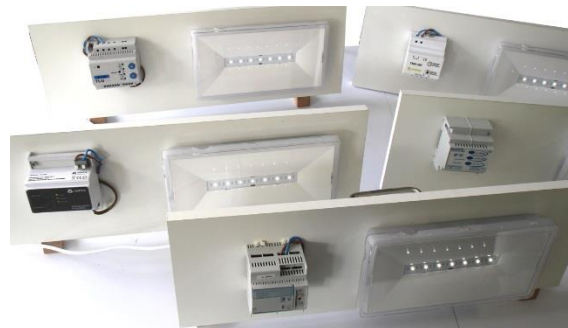
Tableau des compatibilités

L'ensemble des modèles standards (TC) des Blocs d'Éclairages de Sécurité BLOC.TECH : BAES, BAEH et Bi-fonctions dispose de la fonction Universelle BLOC.TECH. Les éclairages de sécurités BLOC.TECH réagissent aux fonctions Allumages et Extinction des télécommandes des marques listées dans ce document, conformément aux exigences de la norme NF C71-820. Seules ces fonctions sont garanties.