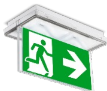
Ref : AKC.S206 Drapeau double face