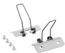
Ref : AKC.UN000 Kit montage encastrée