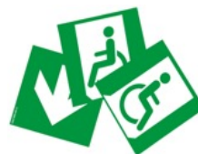
PICTO-S-PMR Pictogramme pour personne à mobilité réduite